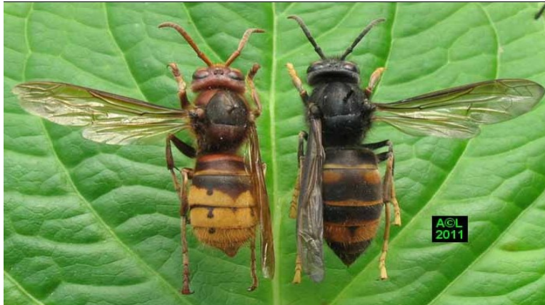
COMPARAISON DES FRELONS EUROPÉENS ET ASIATIQUES