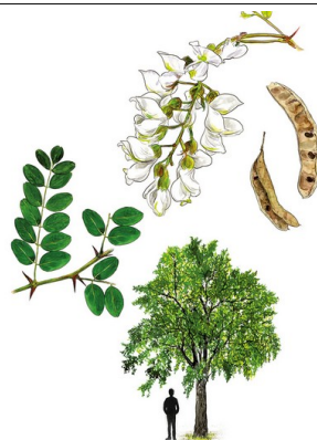
Robinier faux acacia (image K. Widmer)