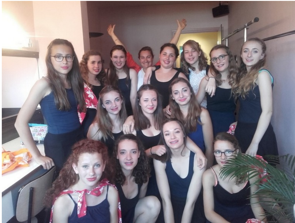
Groupe au championnat de France à Privas, en mai 2016, sur une chorégraphie en hommage à Jacques Brel.