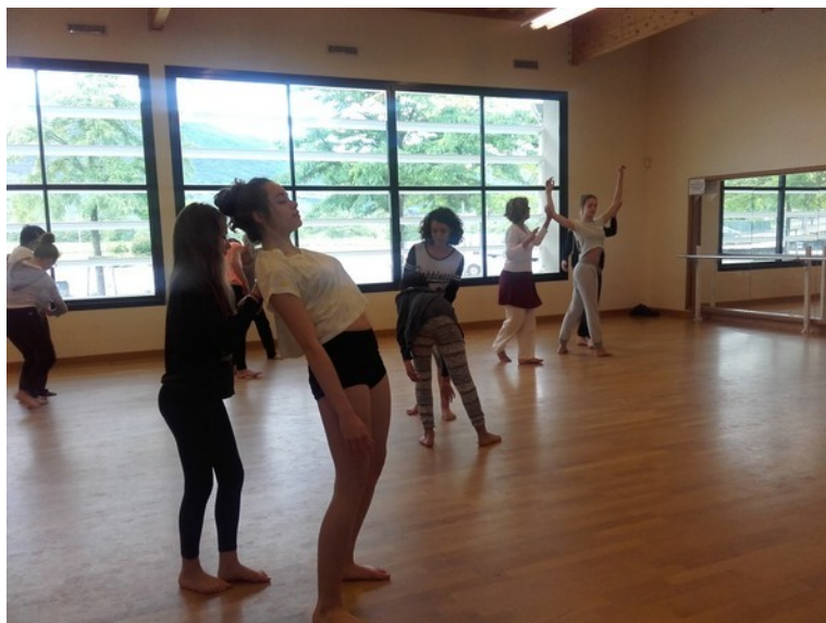
Atelier danse au championnat de France UNSS à Privas en juin 2016.