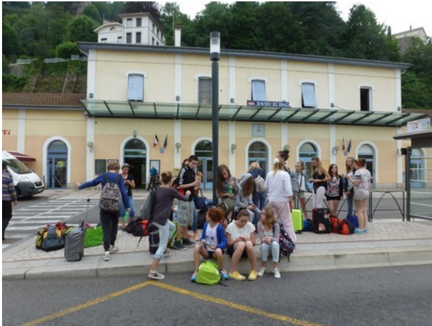
Gare de Vienne, mai 2015.