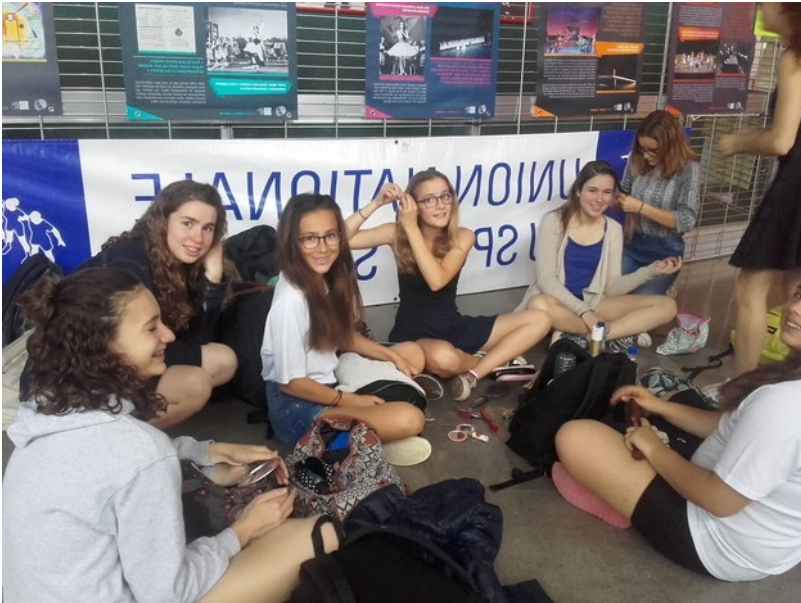
Privas, juin 2016.