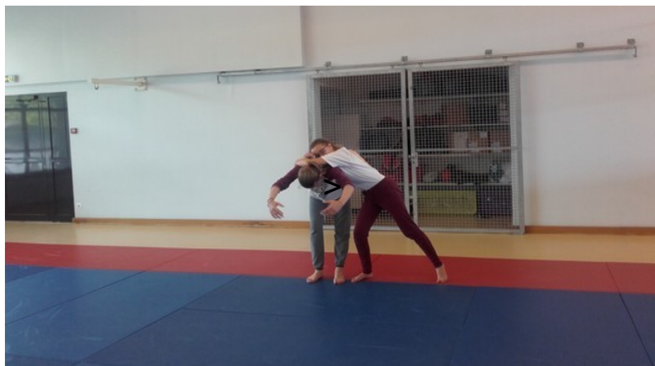
Atelier de Hip-hop au championnat de France de Danse UNSS à Nancy en mai 2014 .