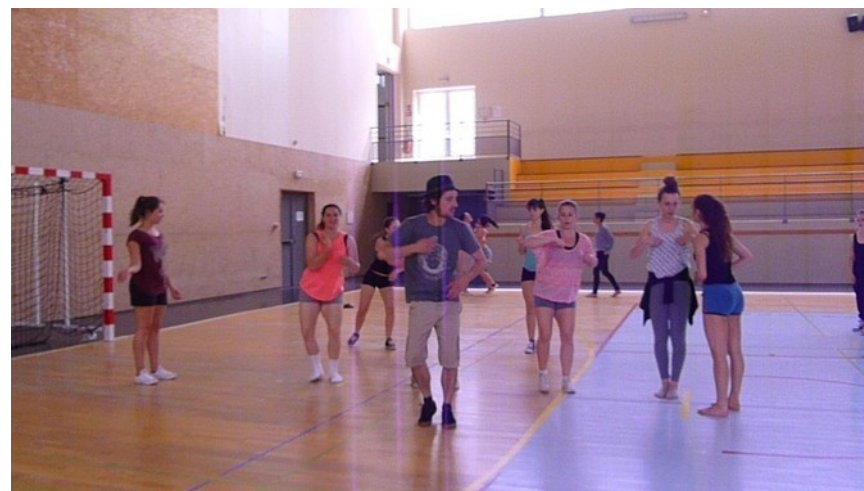
Atelier danse au championnat de France UNSS de Saint-Cyr sur Loire en mai 2015 .