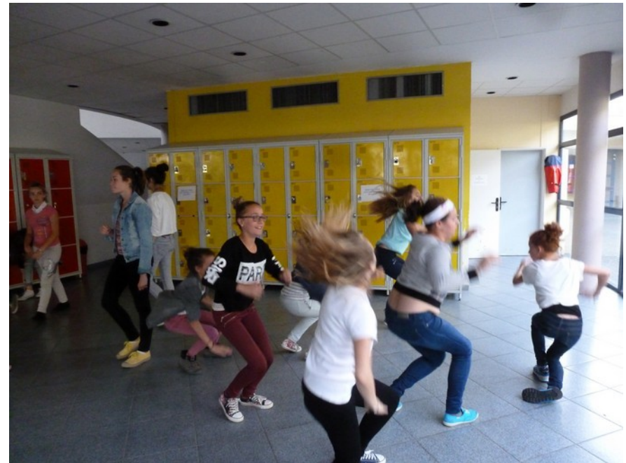
Moment de décompression à Saint-Cyr-sur-Loire en mai 2015 .