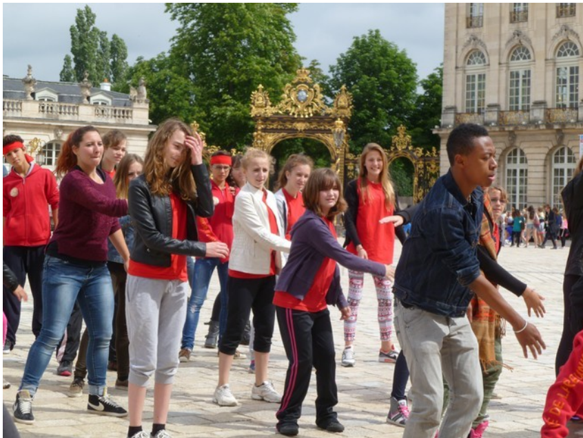
N A N C Y 2 0 1 4